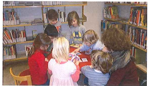
memory over boeken