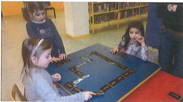
woordrups maken d.m.v. rijmen