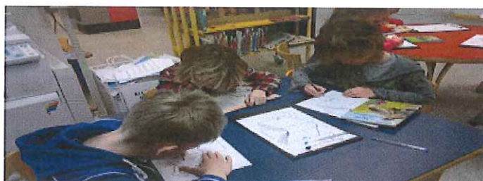
Eerste leesboekjes bekijken en lezen